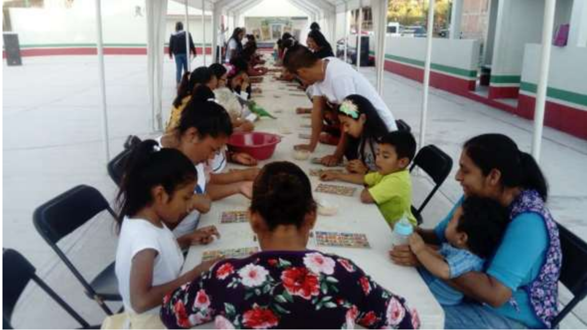
La Secretaría de Desarrollo Social en coordinación con Lectura Itinerante llevaron a cabo la "La Lotería Chilapeña" en el polideportivo del fraccionamiento Diamante, actividad que fomenta la unión y diversión entre las familias de este municipio.